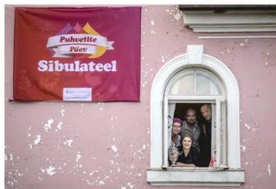
Sibulatee puhvetite päev 2016-2018