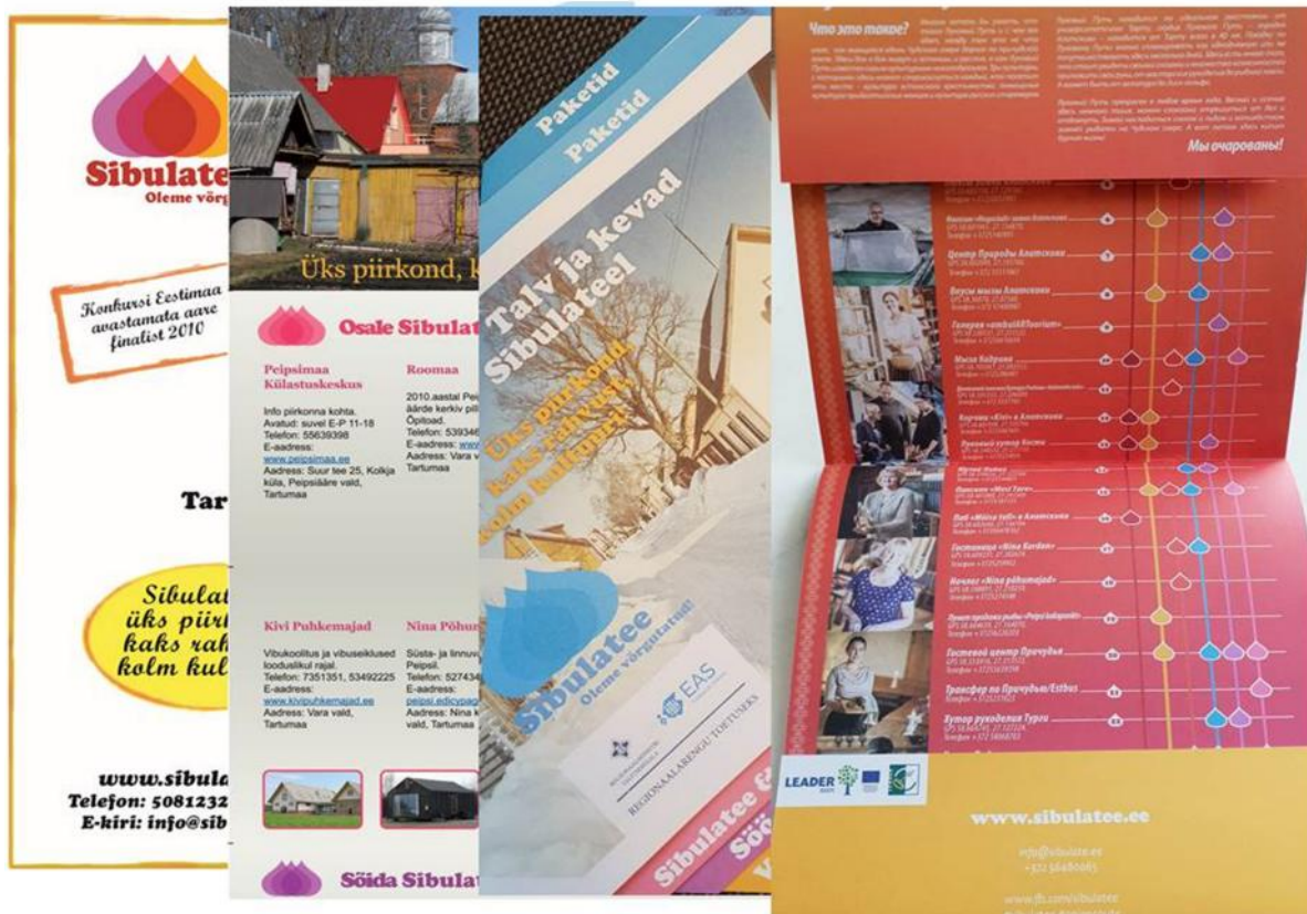
Sibulatee trükised läbi kümne aasta