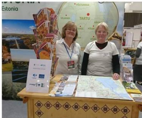
Sibulatee esindused messidel