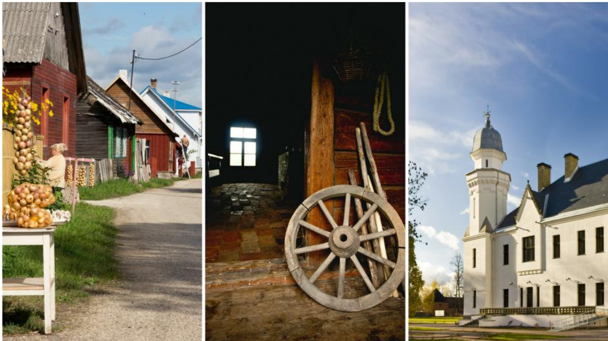
Näited Sibulatee kolmest kultuurist

Sibulatee välismeedias: http://www.sibulatee.ee/en/about-the-onion-route/in-media/